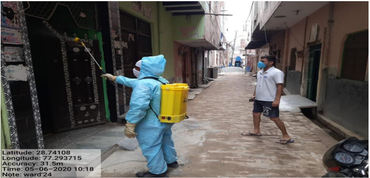
Latitude: 28.74108 Longitude: 77.293715 Accuracy: 31.5m Time: 05-06-2020 10:18 Note: ward'24