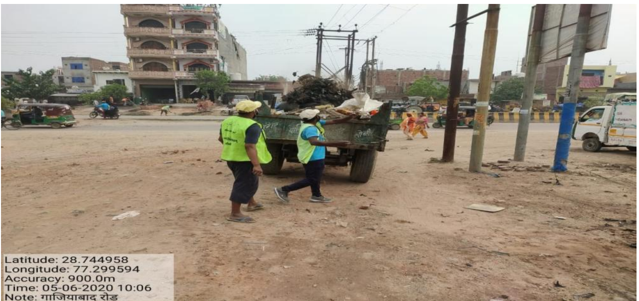
Latitude: 28.744958 Longitude: 77.299594 Accuracy: 900.0m Time: 05-06-2020 10:06 Note: गाजियाबाद रोड