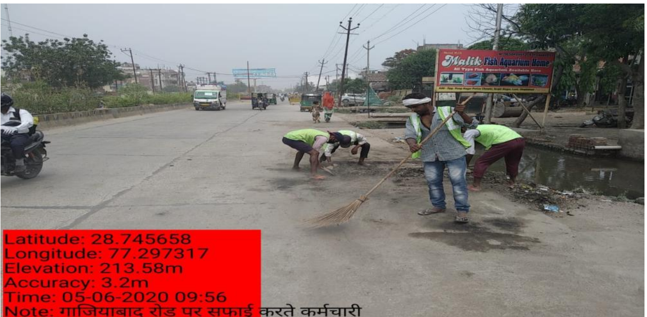
Latitude: 28.745658 Longitude: 77.297317 Elevation: 213.58m Accuracy: 3.2m Time: 05-06-2020 09:56 Note: गाजियाबाद रोड पर सफाई करते कर्मचारी