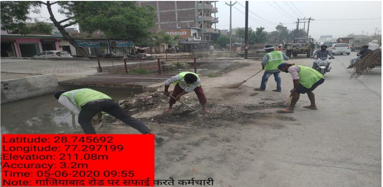
Latitude: 28.745692 Longitude: 77.297199 Elevation: 211.08m Accuracy: 3.2m Time: 05-06-2020 09:55 Note: गाजियाबाद रोड पर सफाई करते कर्मचारी