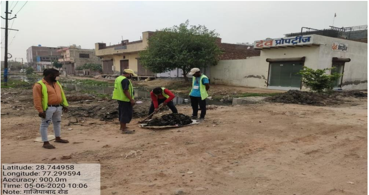
Latitude: 28.744958 Longitude: 77.299594 Accuracy: 900.0m Time: 05-06-2020 10:06 Note: गाजियाबाद रोड