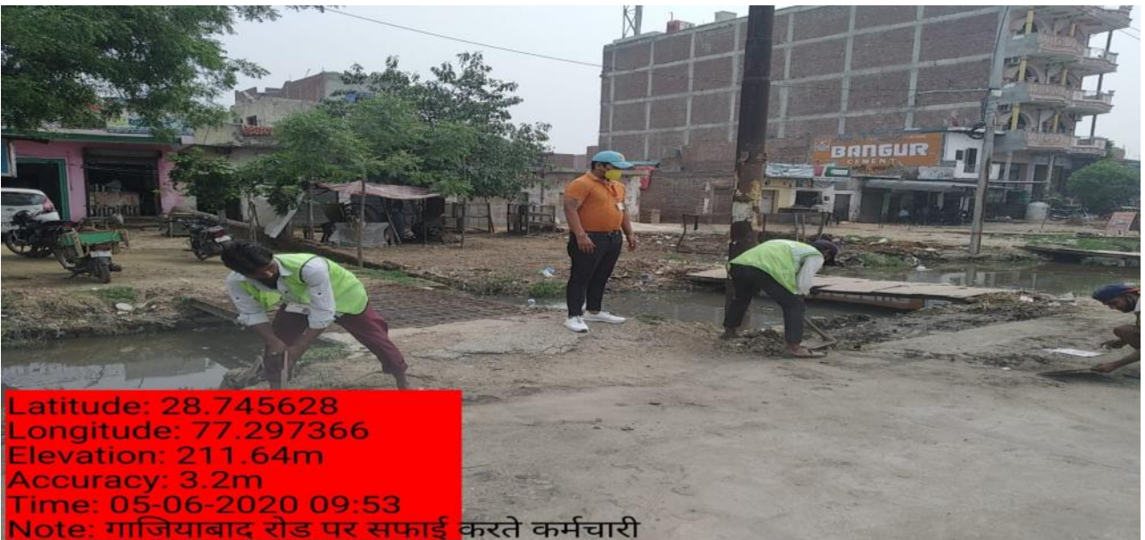
Latitude: 28.745628 Longitude: 77.297366 Elevation: 211.64m Accuracy: 3.2m Time: 05-06-2020 09:53 Note: गाजियाबाद रोड पर सफाई करते कर्मचारी