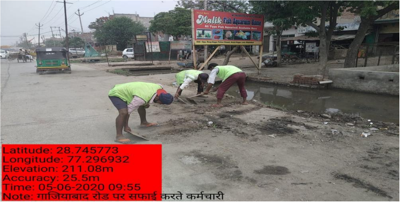
Latitude: 28.745773 Longitude: 77.296932 Elevation: 211.08m Accuracy: 25.5m Time: 05-06-2020 09:55 Note: गाजियाबाद रोड पर सफाई करते कर्मचारी