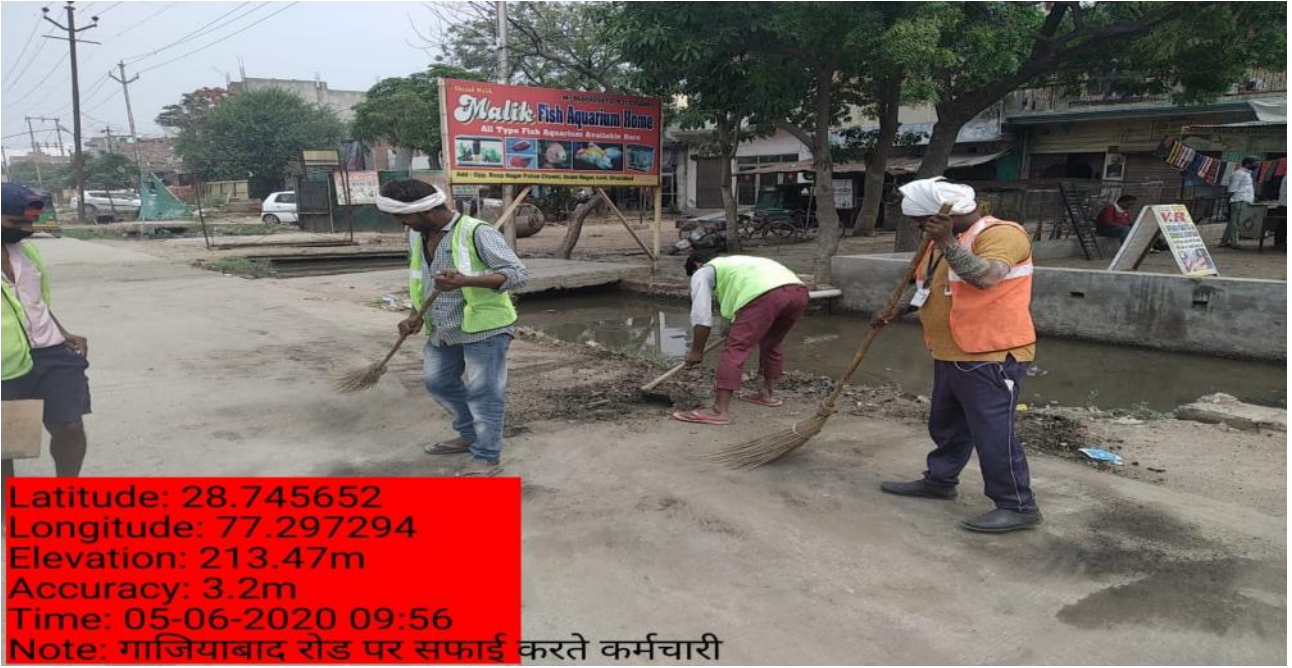
Latitude: 28.745652 Longitude: 77.297294 Elevation: 213.47m Accuracy: 3.2m Time: 05-06-2020 09:56 Note: गाजियाबाद रोड पर सफाई करते कर्मचारी