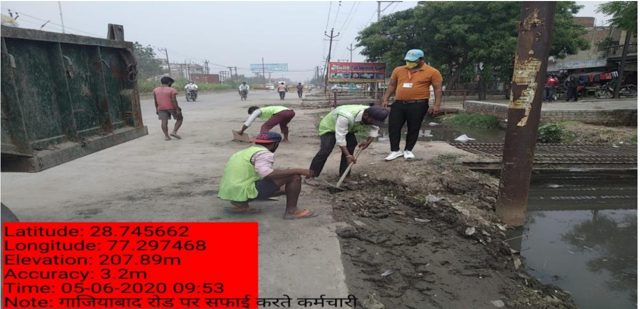
Latitude: 28.745662 Longitude: 77.297468 Elevation: 207.89m Accuracy: 3.2m Time: 05-06-2020 09:53 Note: गाजियाबाद रोड पर सफाई करते कर्मचारी